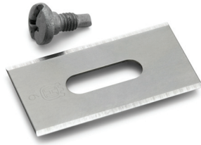
MESSERSATZ, ENDURANCE 595 08 44-03