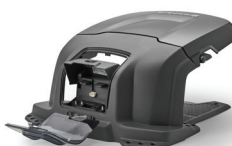
ABDECKHAUBE 587 23 61-01