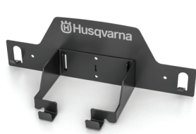
AUTOMOWER® WANDHALTERUNG 585 01 97-02