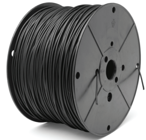
AUTOMOWER® BEGRENZUNGSKABEL HEAVY DUTY 522 91 41-02