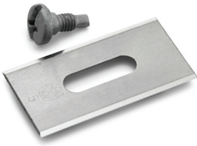
AUTOMOWER® MESSERSATZ ENDURANCE HSS 599 80 52-03