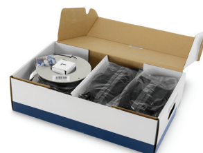
HUSQVARNA AUTOMOWER® INSTALLATION KIT 967 97 23-01