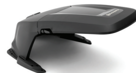
AUTOMOWER® ABDECKHAUBE 597 63 53-01