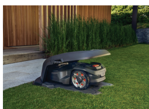
AUTOMOWER® ABDECKHAUBE 536 66 41-01