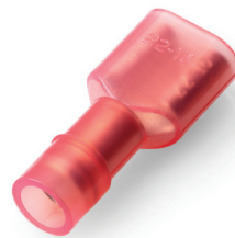
AUTOMOWER® KABELSTECKER 529 28 08-01