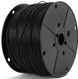
AUTOMOWER® BEGRENZUNGSKABEL 580 66 20-09