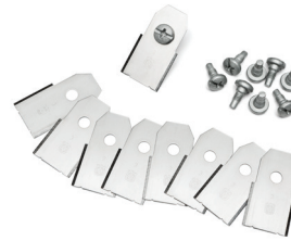
AUTOMOWER® MESSERSATZ CLASSIC 577 60 66-04