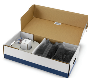
HUSQVARNA AUTOMOWER® INSTALLATION KIT 967 97 22-01