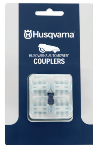
KABELVERBINDER 577 86 47-01