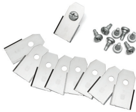
AUTOMOWER® MESSERSATZ CLASSIC 577 60 65-05