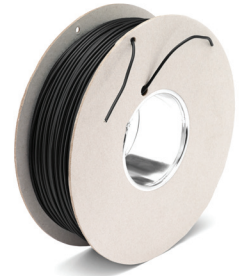
AUTOMOWER® BEGRENZUNGSKABEL 580 66 20-06