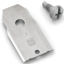
AUTOMOWER® MESSERSATZ ENHANCE HSS 599 80 53-01