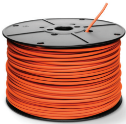
AUTOMOWER® BEGRENZUNGSKABEL PRO 593 29 77-02