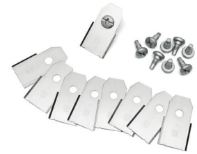
AUTOMOWER® MESSERSATZ, MESSER BEIDSEITIG GESCHLIFFEN 577 86 46-03