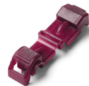
AUTOMOWER® KABELSTECKER 535 12 90-01