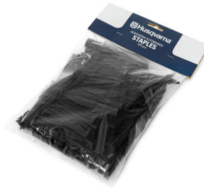
AUTOMOWER® BEFESTIGUNGSKLAMMERN 577 86 42-01