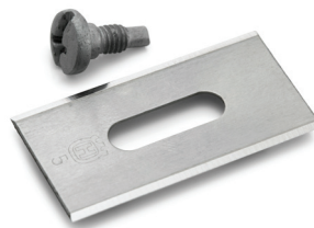
AUTOMOWER® MESSERSATZ ENDURANCE HSS 599 80 52-01