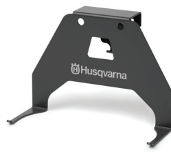
AUTOMOWER® WANDHALTERUNG 597 70 36-01