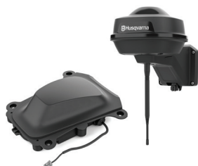
EPOS™ PLUG-IN KIT 970 66 34-04