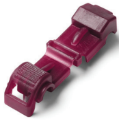
AUTOMOWER® KABELSTECKER 535 12 90-02