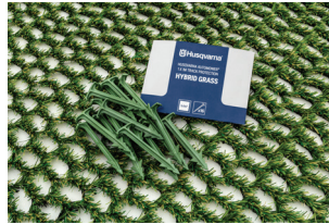
AUTOMOWER® HYBRID-KIT RASENNETZ 598 89 60-01