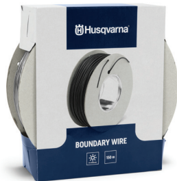
AUTOMOWER® BEGRENZUNGSKABEL 597 23 78-01