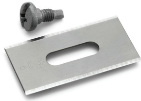
MESSERSATZ, ENDURANCE 595 08 44-02