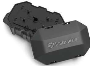
AUTOMOWER® FLÄCHEN-SWITCH 529 45 97-01