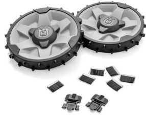
AUTOMOWER® HINTERRAD-KIT 581 88 97-02