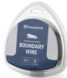
AUTOMOWER® BEGRENZUNGSKABEL 597 23 78-02