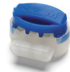
AUTOMOWER® KABELVERBINDER 501 98 02-01