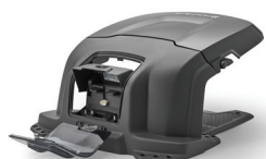
ABDECKHAUBE 585 01 94-01