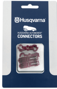
KABELSTECKER 577 86 48-01