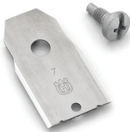
MESSERSATZ, ENHANCE HSS 599 80 53-02