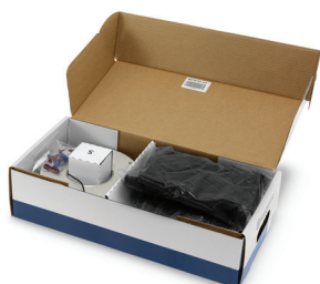
AUTOMOWER® INSTALLATIONS-KIT 967 97 21-01