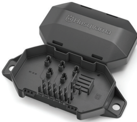
AUTOMOWER® ANSCHLUSS-BOX 599 80 17-01