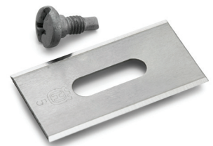
MESSERSATZ, ENDURANCE HSS 599 80 52-02