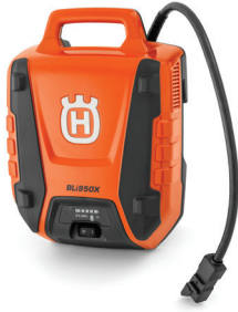
AKKU-RUCKSACK 579 82 22-01