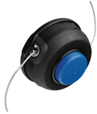
TRIMMERKOPF T25 578 44 61-01