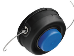
TRIMMERKOPF T35 578 44 63-01