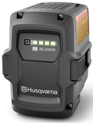
AKKU BLI200X 970 44 89-01