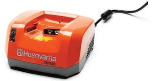
AKKU-LADEGERÄT QC500 970 44 95-06