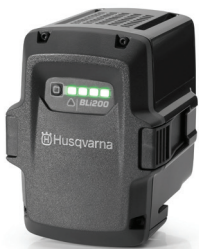
AKKU BLI200 967 09 19-01