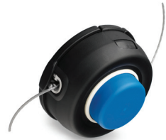
TRIMMERKOPF T35X 578 44 65-01