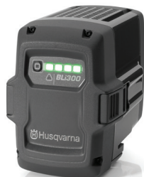
AKKU BLI300 967 07 19-01