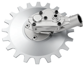
KREISELSCHERE RA-V 967 90 86-01