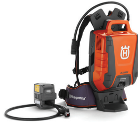
AKKU-RUCKSACK BLI950X 967 09 32-01