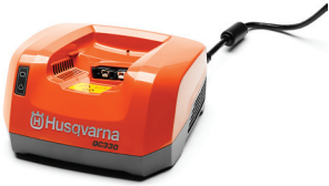
AKKU-LADEGERÄT QC330 970 52 22-06